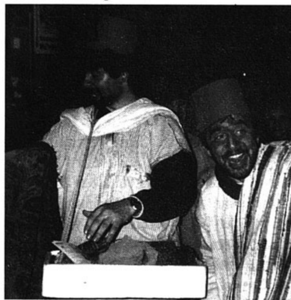
Así rezaba la sentencia:

Don Carnal fue hecho preso y maniatado con pesadas cadenas. Se le cubrió con ceniza. Se trajo, como juez supremo, dada la categoría del reo, a un magistrado famoso de Roma, que utilizó todos los recursos habidos para persuadirle de sus pecados y desmanes. No le fue nada fácil y recurrió, como último extremo, al vil castigo, a la dura e inmoladora penitencia.