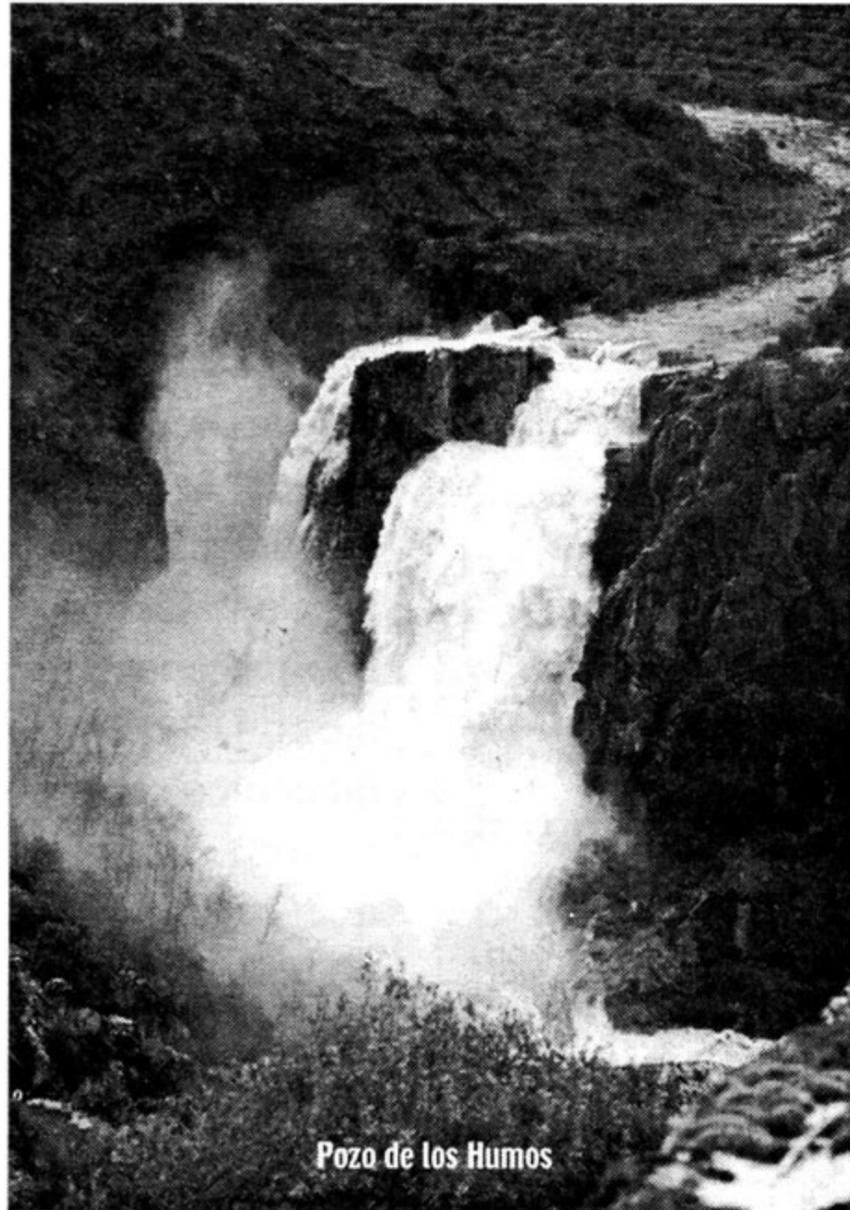
Pozo de los Humos

Cómo llegar Desde Salamanca por la carretera C-517 hasta Vitigudino y después tomamos la carretera que va a Masueco SA-314 pasando por la Peña, donde podremos admirar la gran roca granítica semejante a los Panes del Azúcar de Brasil (nos llevaremos una sorpresa que merece la pena). Finalmente desde aquí nos acercaremos a Pe-