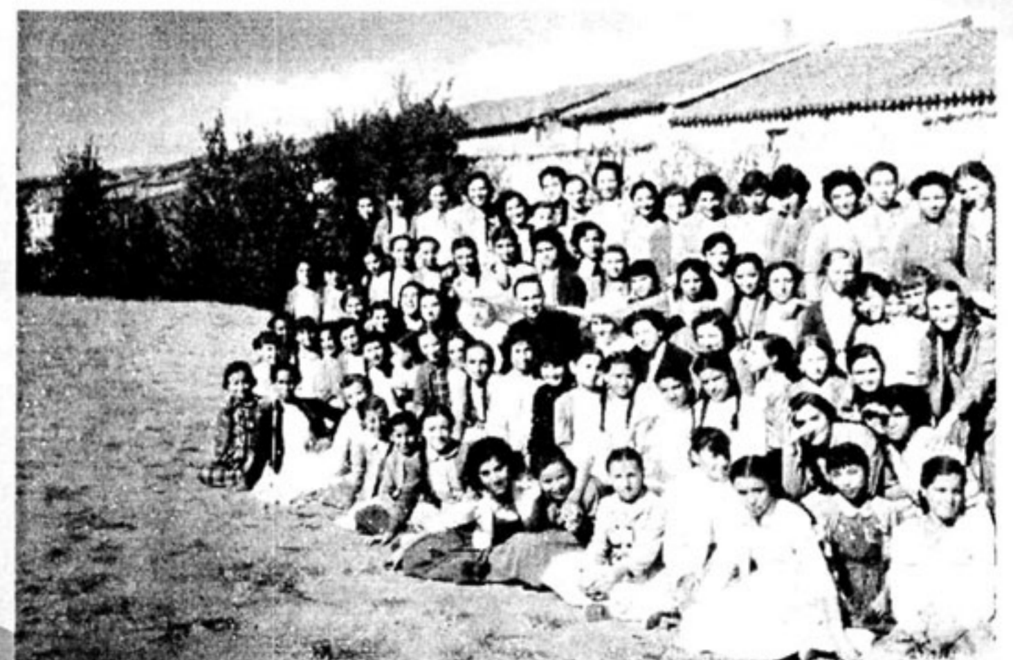
En el hospital, posan las niñas tras una tanda de ejercicios espirituales.