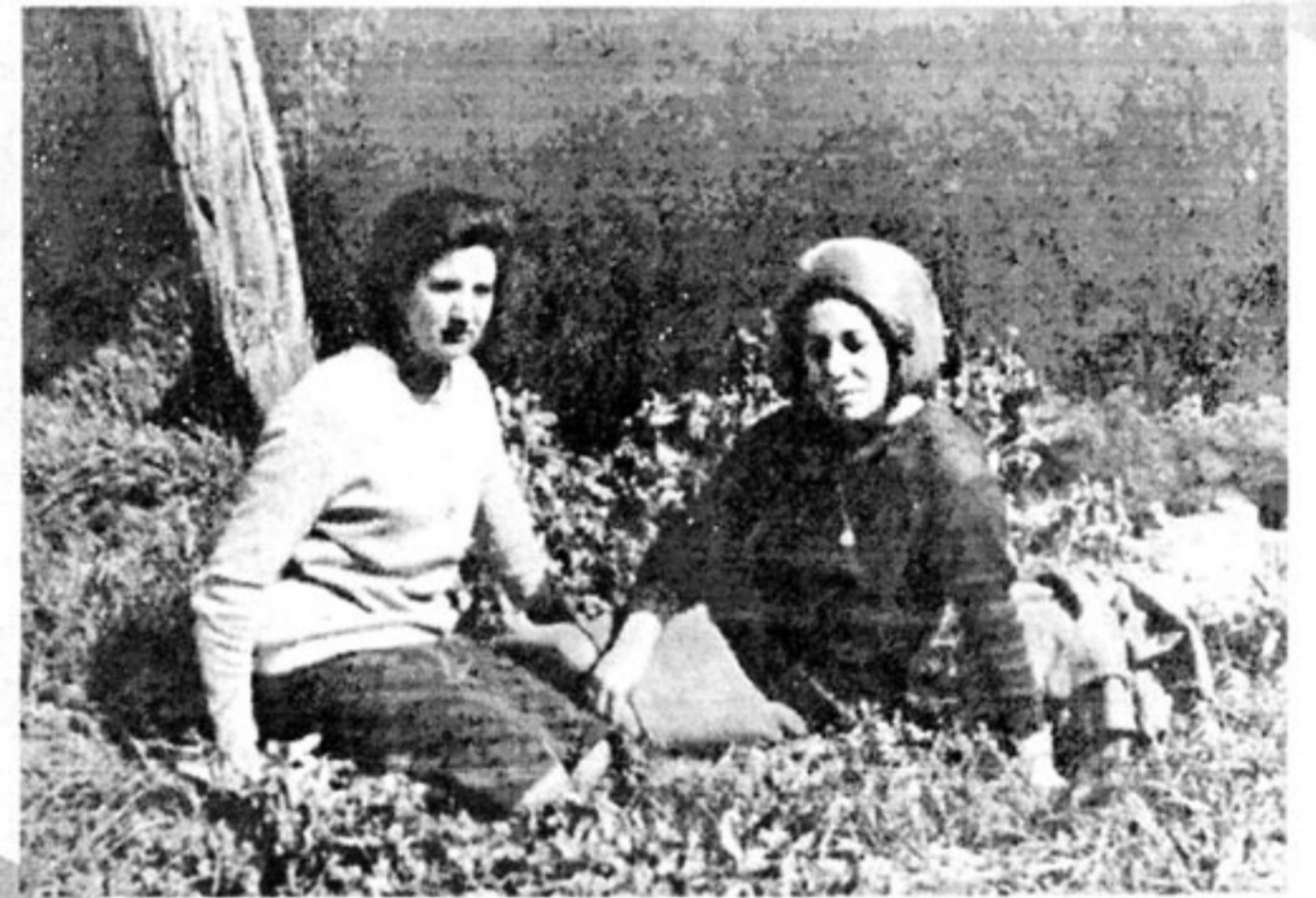
Dos bellezas emergen del césped.