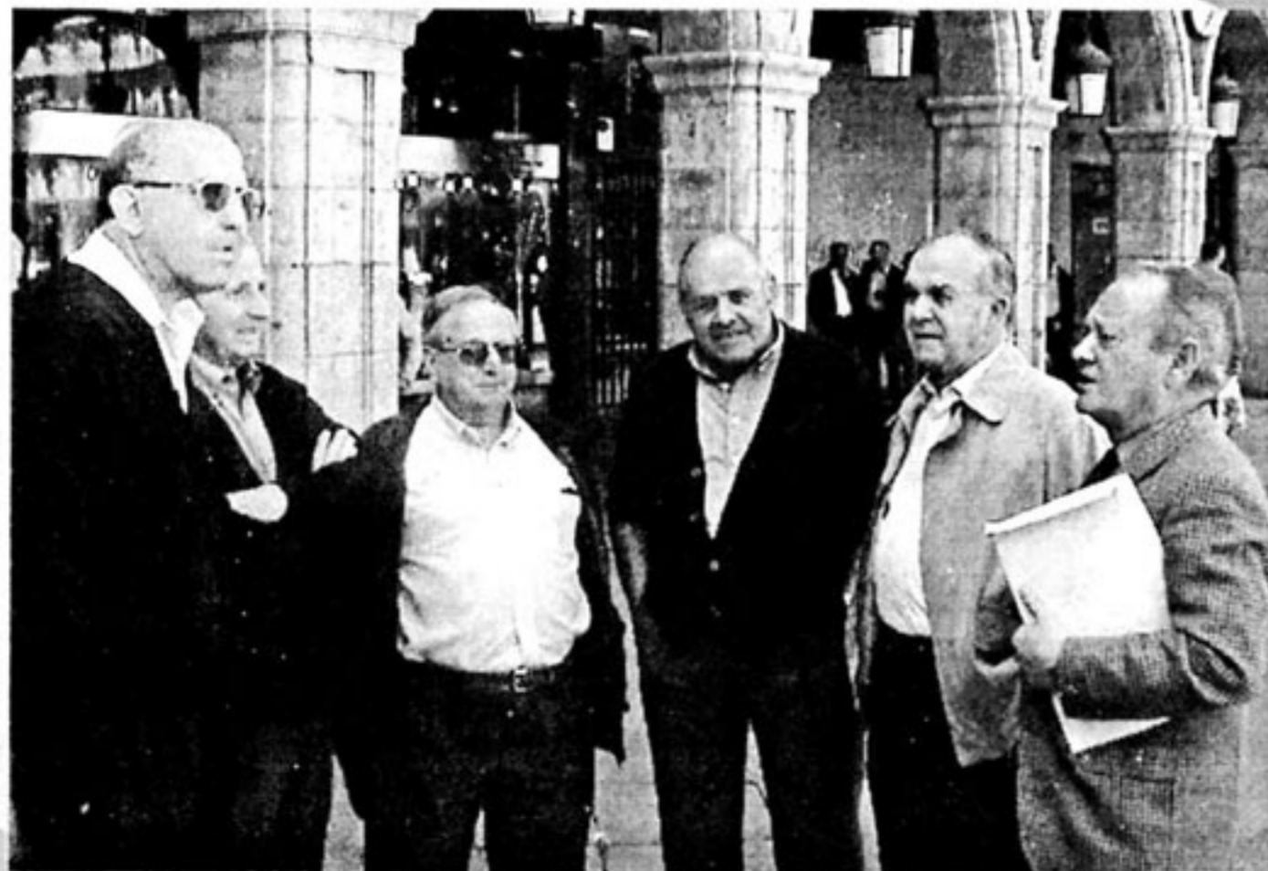
Macoteranos de tertulia en la plaza de Salamanca.