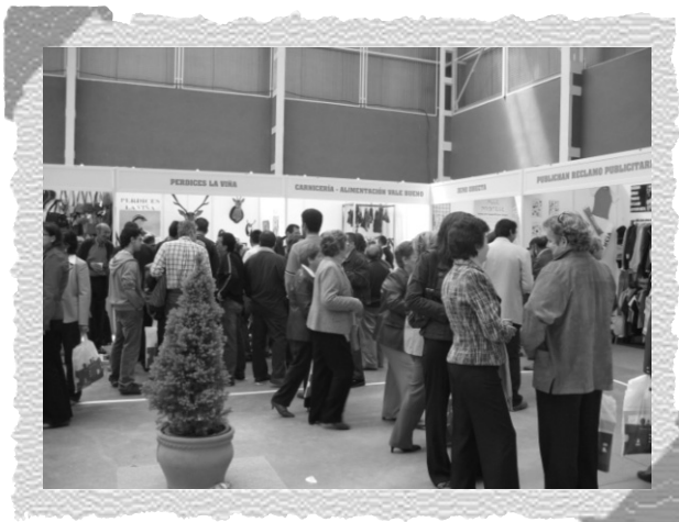
Momento de la 1ª Feria Agroalimentación de Macotera