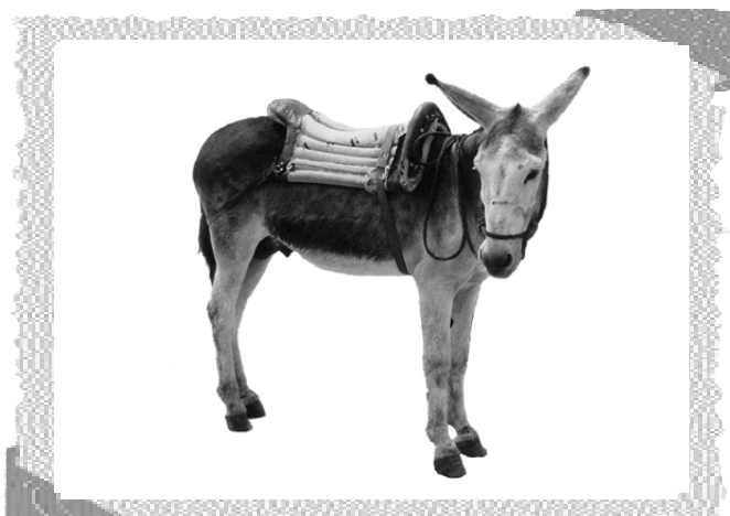
Maravillas, el burro más famoso del mundo