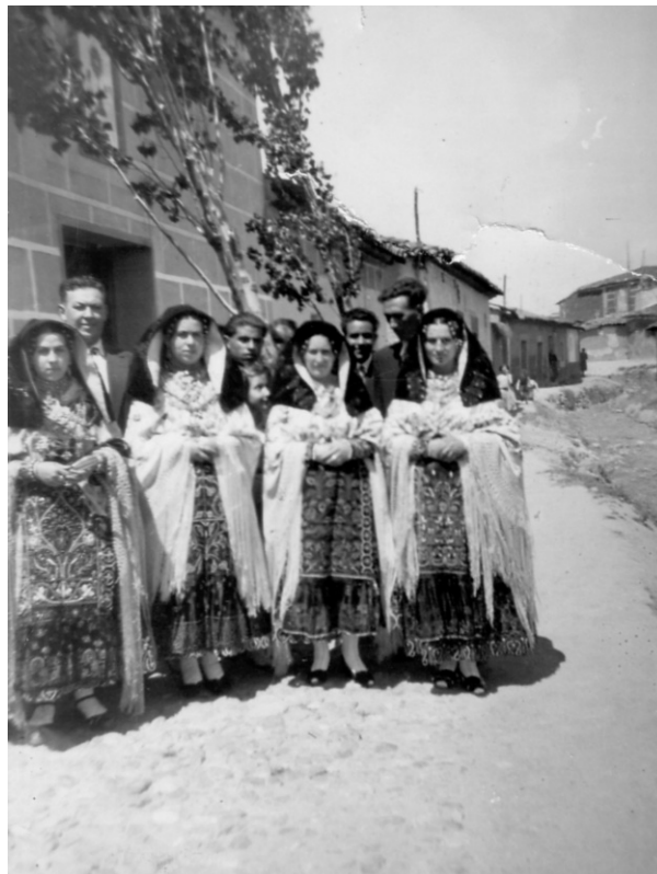
Función del Señor. Muñidoras; los chopos flanquean la puerta del mayordomo.

Asimismo, ha tenido noticia (el señor Obispo), por el escrutinio secreto, que los mayordomos del Santísimo Sacramento juntan, en su casa, después de vísperas de la víspera del Corpus, a muchos hombres y mujeres del lugar, y los dan de beber con gran exceso y peligro de esta junta de hombres y mujeres; mando, a los dichos mayordomos, so la misma pena de excomunión mayor y de cien reales, que, de aquí en adelante, no den este refresco, y, a los curas, que den aviso de los mayordomos, que no cumplieren este mandato; y que la procesión del Corpus haya de salir a las diez del día, sin esperar a que el mayordomo y sus convidados acaben de almorzar, porque es indecencia, que la procesión esté detenida por esta causa, y que los seglares determinen la hora a que ha de salir, tocando a los curas determinarlo".