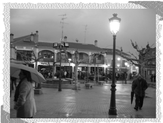
Esperan que escampe para celebrar el Santo Entierro