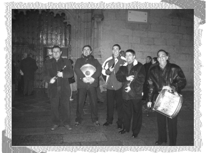
Los dulzaineros acompañan el silencio del Entierro con melodías clásicas