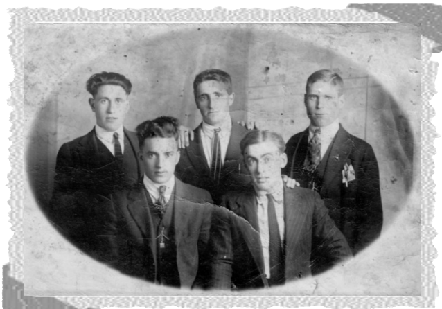
Macoteranos en California