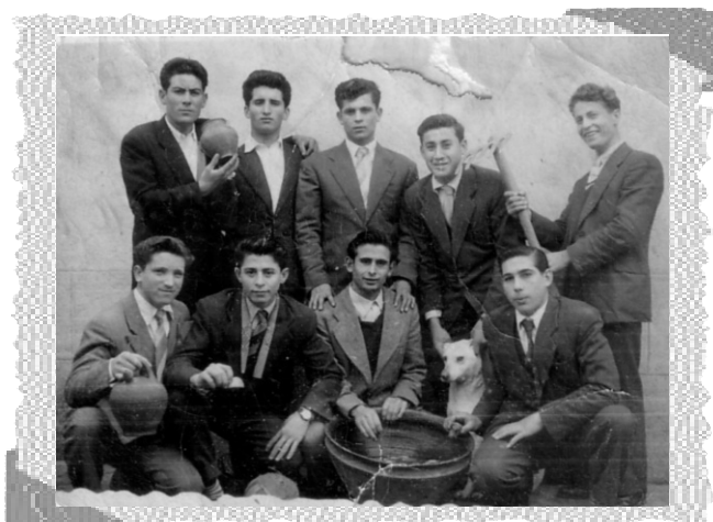
Panda de amigos