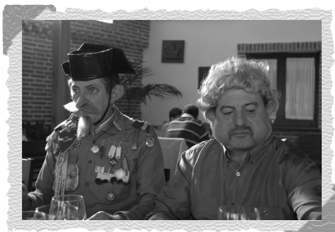
Escena del Carnaval 2009.