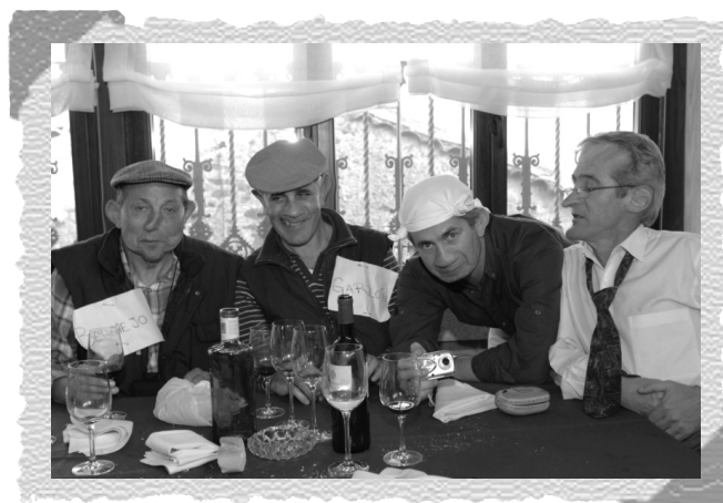
Escena del Carnaval 2009.