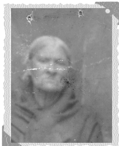
Pascua la Sexmera.