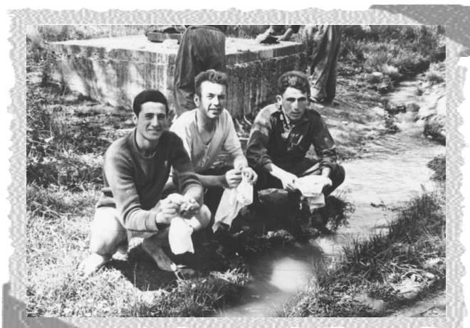
los soldados también sabían lavar en el río.