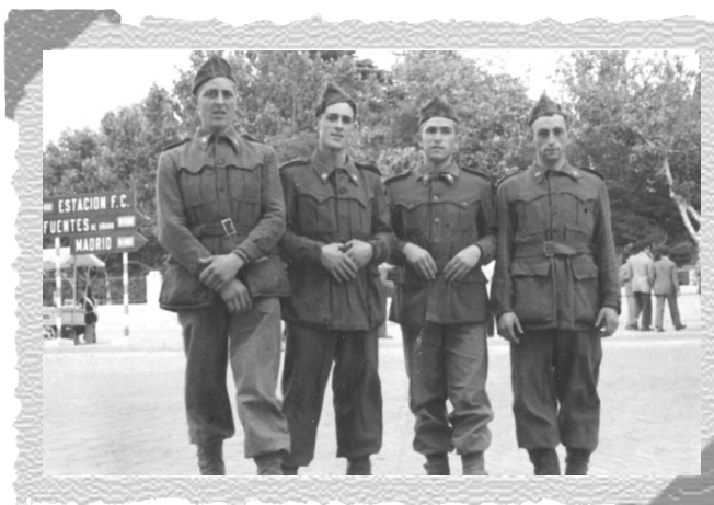
Recuerdos de mili.