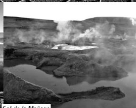
Sol de la Mañana