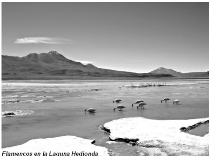
Flamencos en la Laguna Hedionda