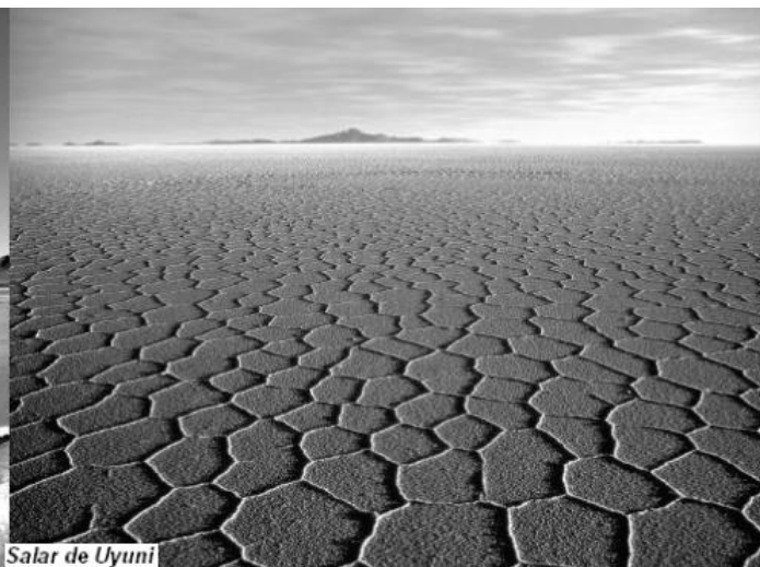
Salar de Uyuni