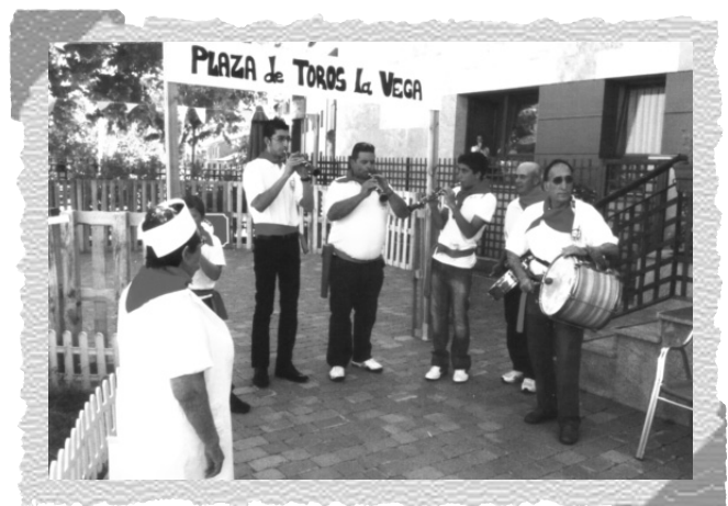
La cantera de los Adobes, en la Residencia "La Vega" de Salamanca