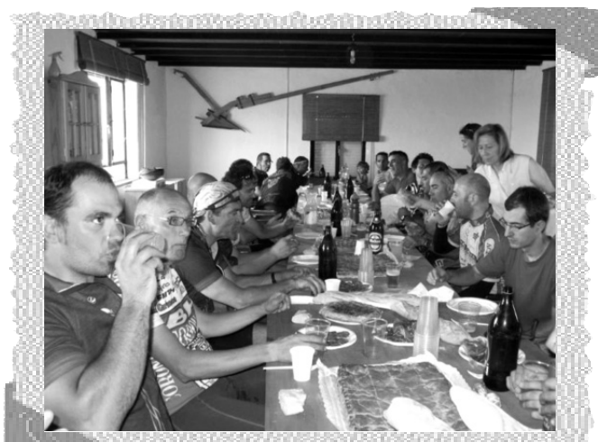
Comida de los esforzados en Malpartida