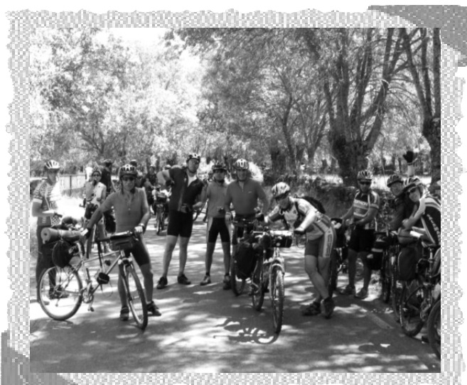
Marcha en bici "La Transmorucha"