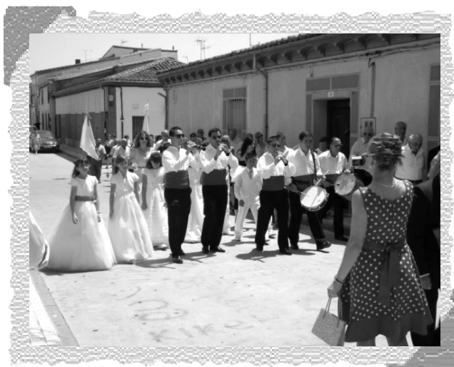
Niños de comunión y dulzaineros en la procesión del Corpus