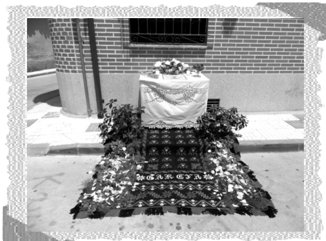
Mesa sacramental para la Procesión del Corpus