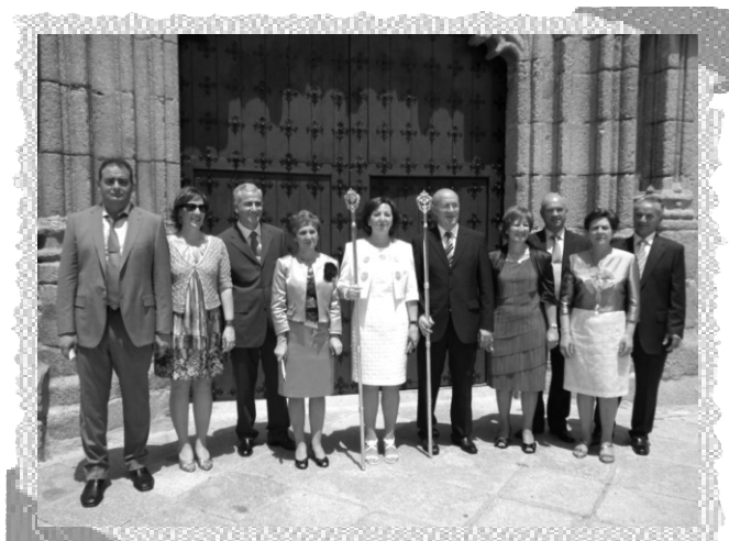
Mayordomos del Señor 2011