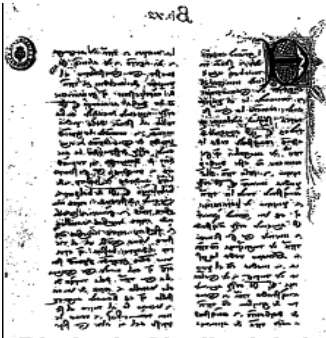
Diario de Clavijo del viaje (Biblioteca N. de Madrid)