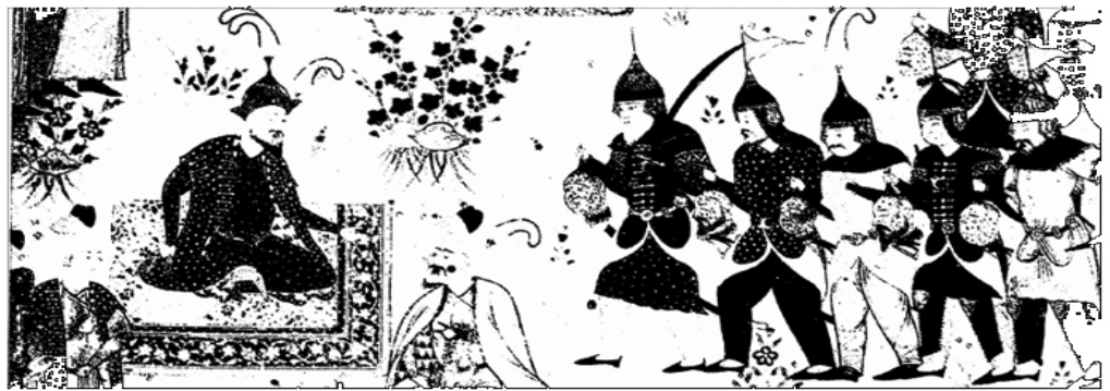
Tamerlán hizo decapitar a los habitantes de Bagdad (Londres, Museo Británico)

Samarkanda (Samarcanda) remonta su pasado al primer milenio antes de Cristo y es considerada como la ciudad más antigua de la ex Asia Central Soviética. En la Ruta de la Seda se constituyó como uno de los puntos más importantes de parada, uniendo China con Europa. Actualmente es una ciudad en la que conviven sus antiguos vestigios con modernos edificios, universidades y fábricas.