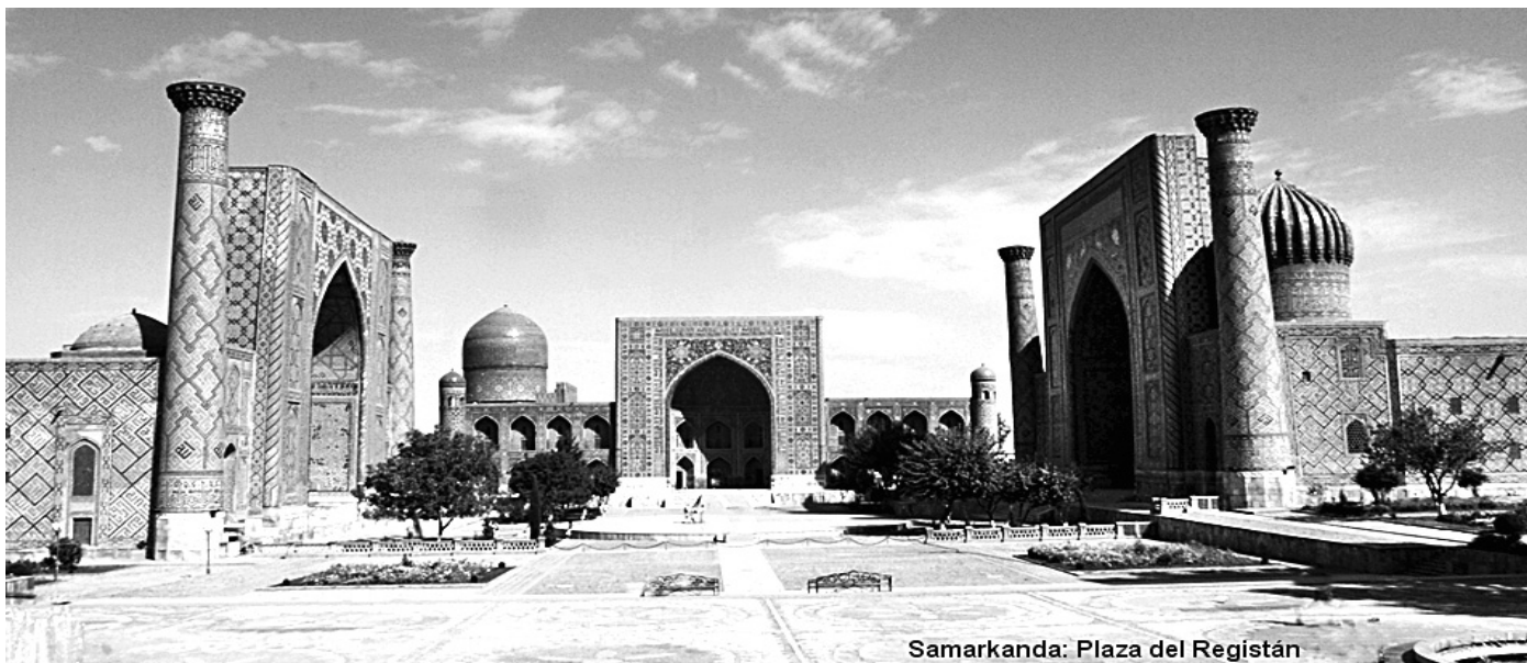
Samarkanda: Plaza del Registán