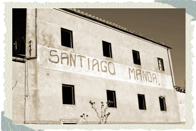
República Independiente de Santiago.