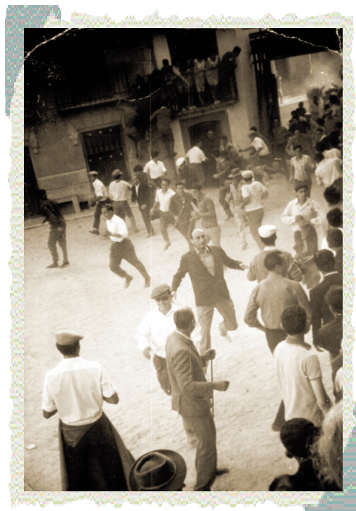
Llegada de los novillos a la plaza.