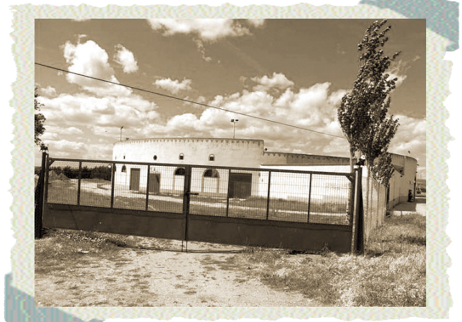
La plaza de toros, enjaulada.