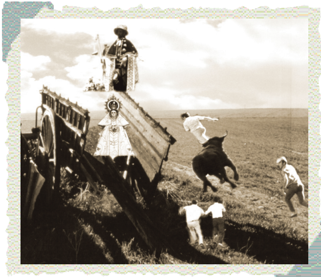
Un encierro protegido.