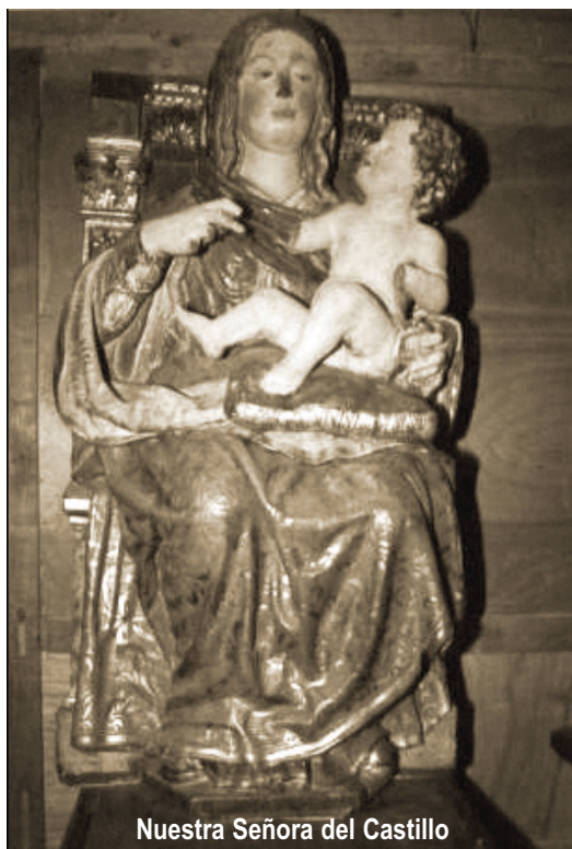
Nuestra Señora del Castillo

El entallador, llamado también tallista o ebanista, se dedicaba a la labor de la talla de la madera; es el encargado de la parte