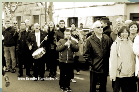
Los dulzaineros animando la san Silvestre.