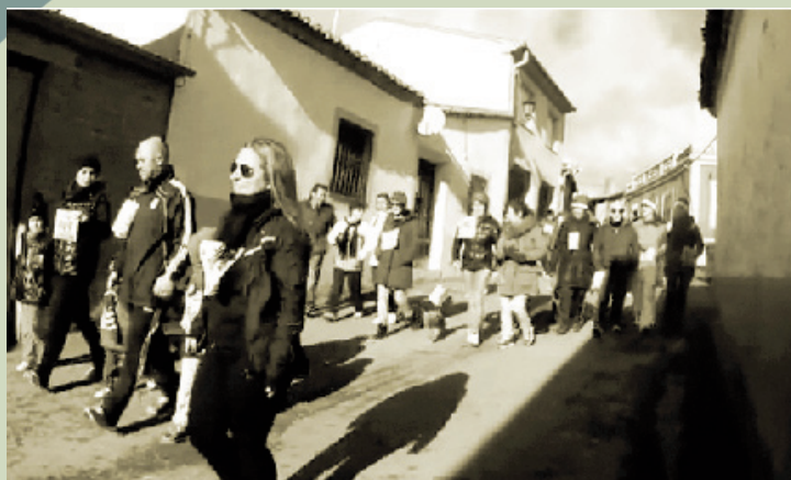
Marcha solidaria 2013.