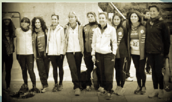
Chicas del Club Atletismo Macotera.