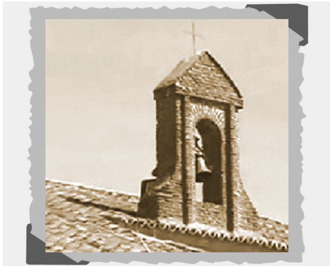
Campana de la ermita de Santa Ana.