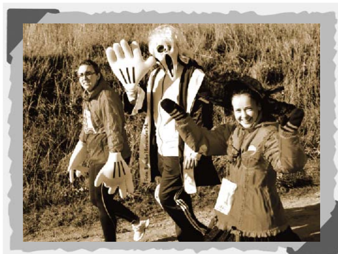
Detalle de la marcha solidaria