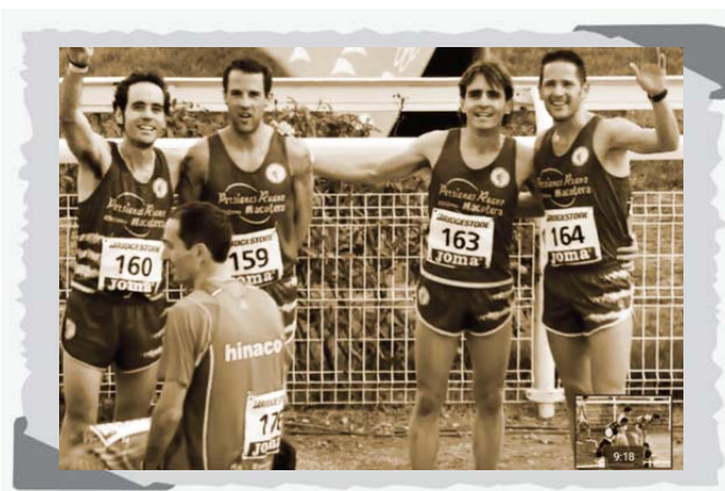
En campeonato de Clubes de Campo a Través 2016.