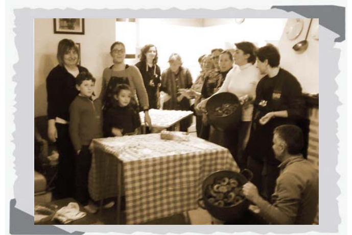
Preparando rosca para la lengua macoterana.