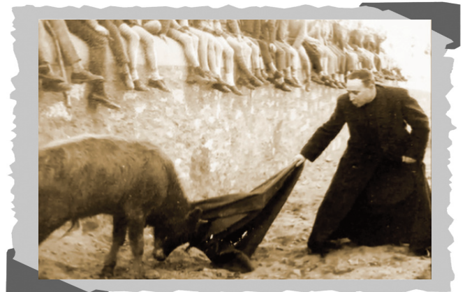
Don Clemente equivocó la vocación.