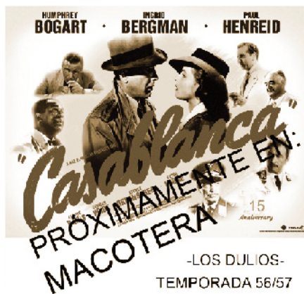
-LOS DULIOS- TEMPORADA 56/57

A menudo pasaban cosas curiosas en el cine. En una ocasión, el famoso Agapito -que ayudaba a meter los bancos debajo del escenario- quedó atrapado dentro y, cuando empezó la película; -por cierto, de terror-, intentó salir por la escalerilla que tapaba la entrada, provocando un gran ruido y sembrando el pánico en los espectadores, que estuvieron a punto de salir corriendo.