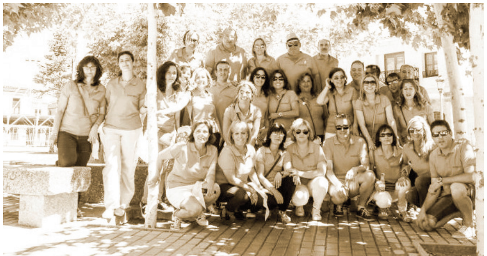
Reunión de los quintos del 67 en Macotera