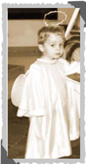
Un angelito del Cielo