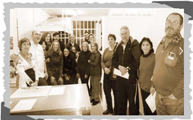
Alumnos del curso de cocina