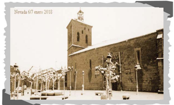
¡Ay qué fenómeno, si no hace ruido!