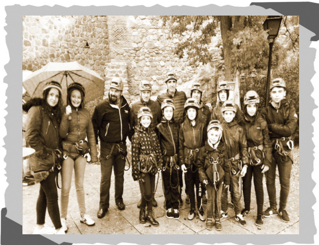
Padres e hijos se tiraron por la tirolina, en Toledo.