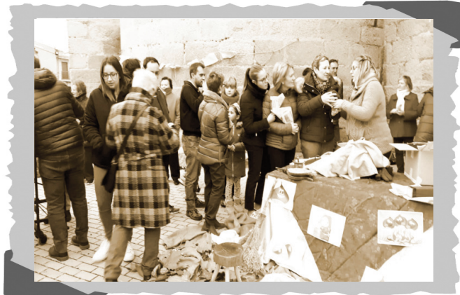
Jornada castañera 2018.