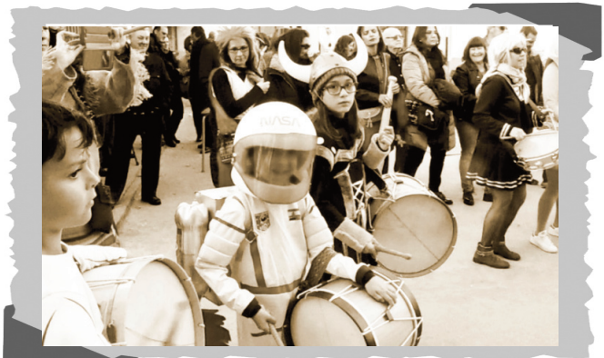
Desfile infantil en carnaval