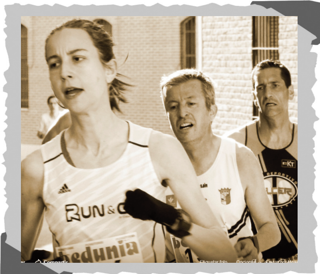
6ª legua "villa de Macotera", 2019