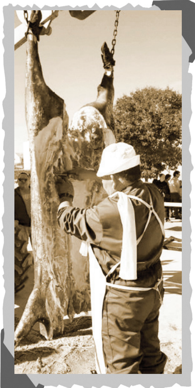
16 de febrero 2019, día de la matanza.