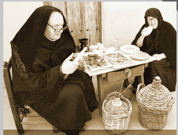
Ayuntamiento de Macotera Ancianas reponiendo fuerza. — en Yo me quedo en casa.