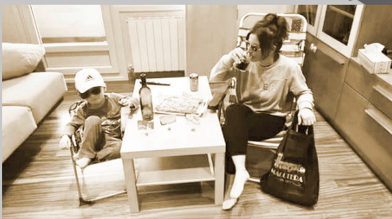
Concurso de fotografía. Lunes de Aguas. Ayuntamiento 2020.