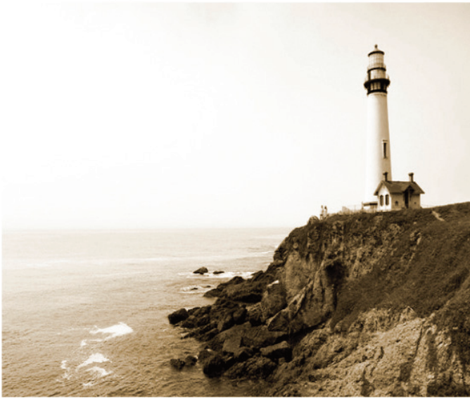
Faro de las Islas Feroe (situadas en el Atlántico Norte).

El resultado es un bacalao de gran calidad, único en el mercado y con infinidad de posibilidades culinarias.