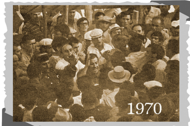
Se cayó el tablado, 1970