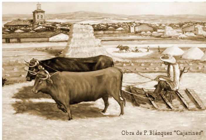
Obra de P. Blázquez "Cajarines"

Las mujeres solían trillar por la tarde mientras los hombres merendaban, aunque no era raro ver jóvenes con el pañuelo bien amarrado a la cara y el sombrero, para no amorenarse , (pues, entonces, la blancura era señal de belleza), y echaban una mano al padre.