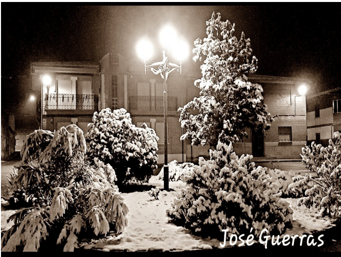
Nevada en la noche 22-23 de noviembre, 2021