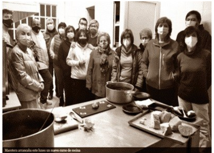
Macotera arranca este lunes un nuevo curso de cocina