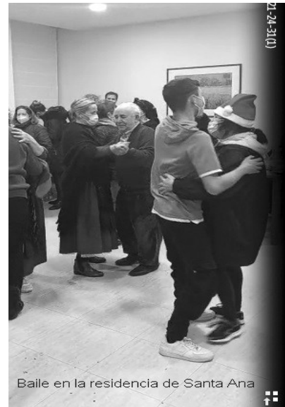
Baile en la residencia de Santa Ana