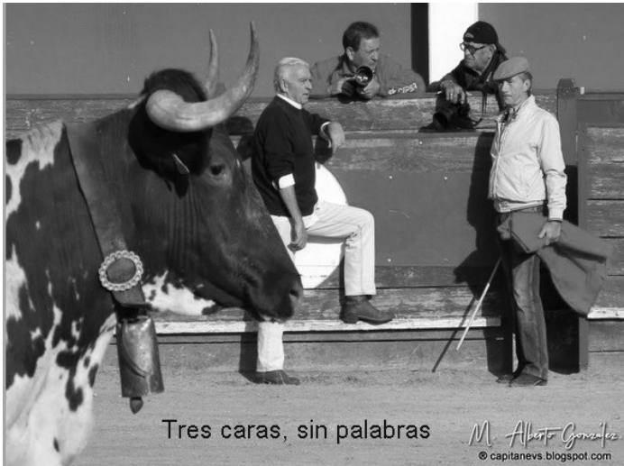
Tres caras, sin palabras

M. Alberto González © capitanevs.blogspot.com