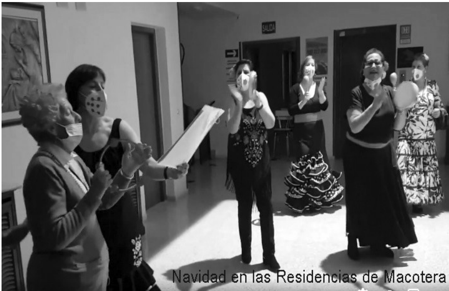
Navidad en las Residencias de Macotera